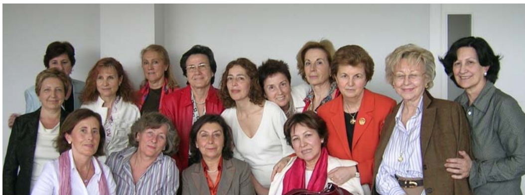
Algunas de las profesoras que han participado en el Seminario sobre Educación y Género. El conocimiento Invisible. UNED, mayo 2008, en el que se presentó este libro.